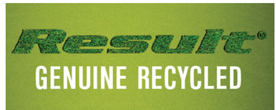
R900M RECYCLED 3-LAYER PRINTABLE SOFTSHELL JACKET